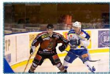
L'équipe de hockey sur glace en plein match

Un des piliers du hockey sur glace en Aquitaine et dans le grand Sud-Ouest, le club compte plus de 200 licenciés et 9 équipes en championnat de France. L'équipe Sénior, après sa montée en Division 1 en 2005/2006, s'est qualifiée en 2007/2008 pour les demi-finales du Championnat de D1 et en 2008/2009, aux quarts de finale et fini 3ème de la saison régulière. Le club, qui s'est donné pour vocation d'accueillir et de former les jeunes dès l'âge de 4 ans, a vu cette année l'équipe des jeunes espoirs bordelais Uz2 Excellence accéder au titre de Champion de France.