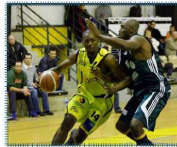
Les Jeunes Saint Augustin Bordeaux Basket en pleine action

Créée en 1938, l'association des ISA propose aujourd'hui 50 activités sportives, culturelles et de loisirs, et compte 3500 adhérents. Après une brillante saison 2008-2009, la section basket des ISA accède cette année au niveau professionnel (pro B). Premier club de basket de Gironde avec ses 320 licenciés, il aura comme vice-président Boris Diaw, joueur de NBA, capitaine de l'équipe de France de basket ball et ancien du centre de formation des ISA. Ses seniors filles et cadets masculins sont au niveau national. Il compte 4 équipes en championnat d'Aquitaine, 15 en championnat de Gironde et 1 école de basket de 120 jeunes.