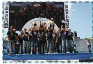
le 31 mai, remise de coupe aux Quinconces (Bordeaux)