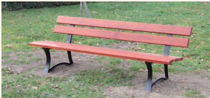
Mise en place d'une quinzaine de bancs publics sur l'ensemble de la commune.