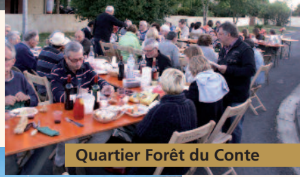
Quartier Forêt du Conte