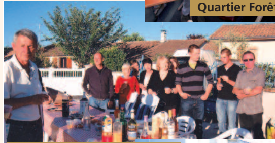
Rue de la Péguillère