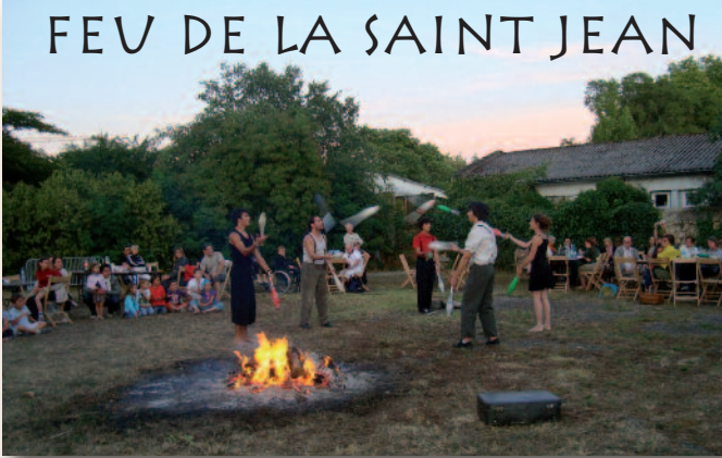
FEU DE LA SAINT JEAN