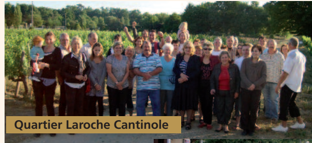
Quartier Laroche Cantinole