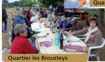
Quartier les Brousteys