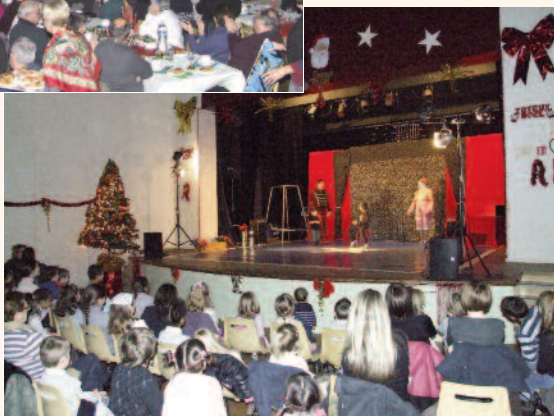
Spectacle de Noël offert aux jeunes Cadaujacais