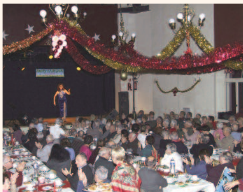
Goûter et spectacle de Noël offerts à nos Anciens