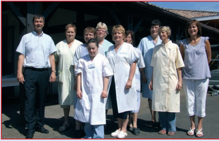
Le personnel du restaurant scolaire de service pour le Centre de Loisirs