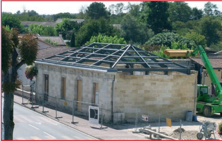
Les travaux de la nouvelle bibliothèque