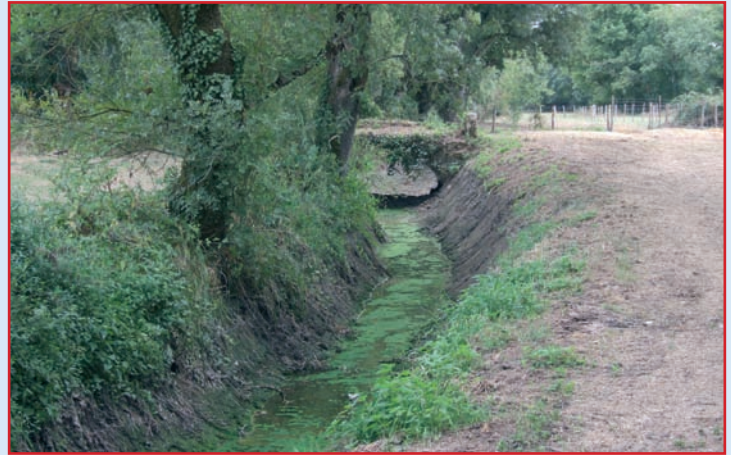
Nettoyage de « La Carruade »