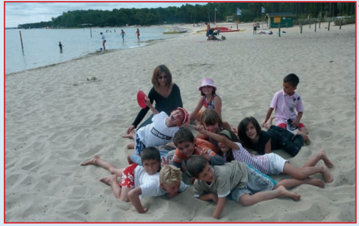
Un groupe d'enfants du CLSH à Bombannes