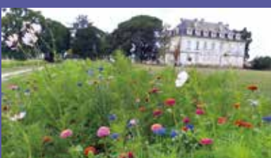
Les jachères du parc du château

Les jachères semées durant le mois de mai dans le parc du château par le service des espaces verts de la Ville ont fleuri ! Un réel embellissement du cadre du parc favorisant la biodiversité et les insectes pollinisateurs.