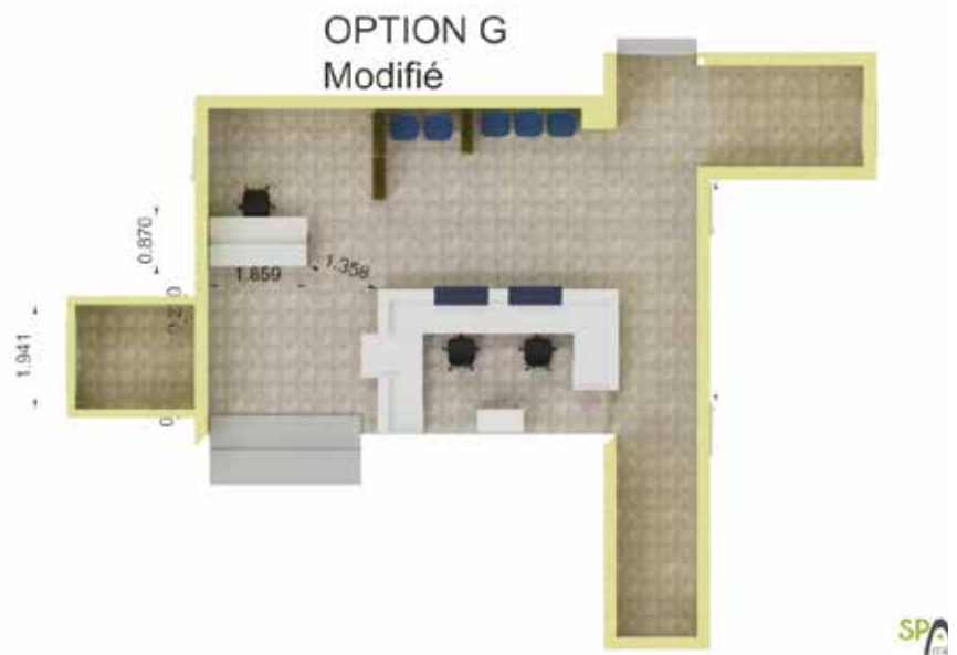
Le service postal communal sera assuré par des agents municipaux. Les locaux de l'Hôtel de Ville seront aménagés durant l'été avec une réorganisation des flux.

Le service sera rendu tous les jours de la semaine, du lundi au samedi matin.